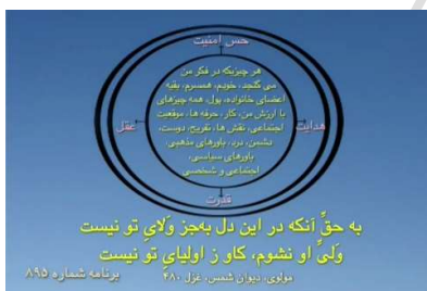
[شکل شماره ۱ (دایره همانندگی‌ها)]