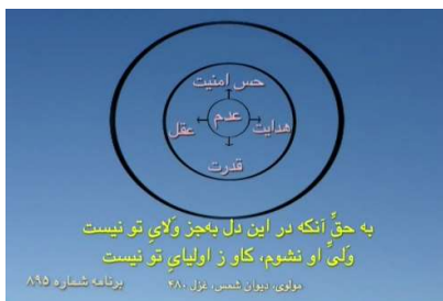
شکل شماره ۰ (دایره عدم اولیه)