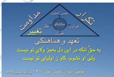
شکل شماره ۳ (مثلث تغییر با مرکز همانیده)

من ذهنی، اصل وجودش برای این است که خداوند را انکار می‌کند، می‌گوید من هستم. و شما می‌بینید که وقتی به صورت من ذهنی بلند می‌شویم، ما چه مسائلی به وجود می‌آوریم و همین‌الآن خواهیم دید که این من ذهنی دائماً در حال ایجاد مانع و مسئله و دشمن هست که هر سه این‌ها دردساز هستند.