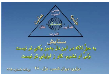
شکل شماره ۷ (مثلث ستایش با مرکز همانیدگی‌ها)