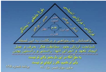
شکل شماره ۱۲ (مثلث بلوغ معنوی)