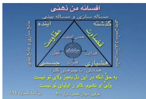
شکل شماره ۹ (افسانه من ذهنی)