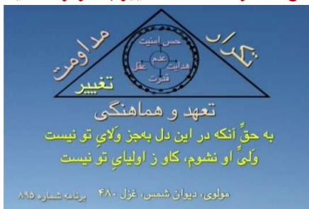
شکل شماره ۴ (مثلث تغییر با مرکز عدم)