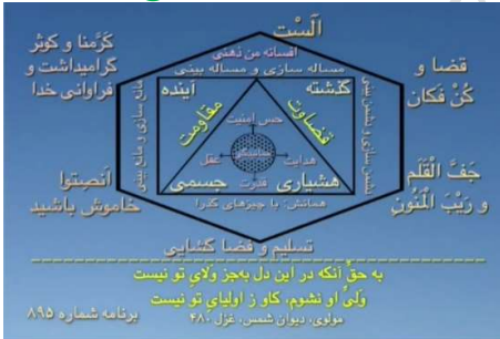
شکل شماره ۱۳ (شش محور اساسی زندگی با افسانه من ذهنی)