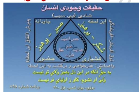
شکل شماره ۱۰ (حقیقت وجودی انسان)