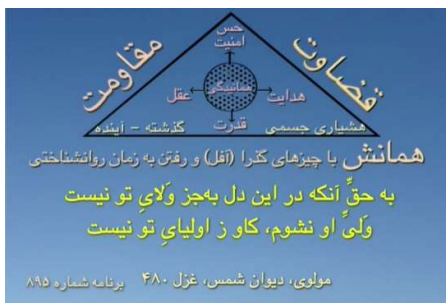
شکل شماره ۵ (مثلث همانش)