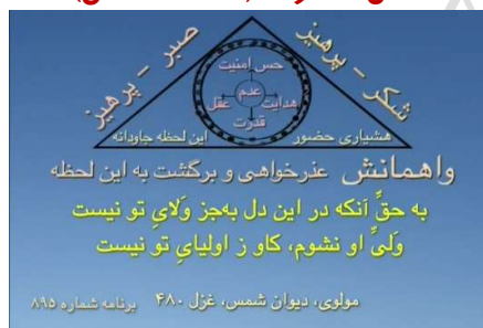
شکل شماره ۶ (مثلث واهمانش)

اما شما می‌دانید که برای این‌که ما به این بیت عمل کنیم فعلاً که من ذهنی داریم [شکل شماره ۳ (مثلث تغییر با مرکز همانیده)] با هشیاری جسمی، که در زمان زندگی می‌کند زمان روان‌شناختی، ما باید مرکز را عدم کنیم [شکل شماره ۴ (مثلث تغییر با مرکز عدم)] و به این عدم متعهد بشویم، تا چندین سال کار کنیم و از این حالت این‌که ما فکر می‌کنیم در مرکزمان غیر از خدا چیز دیگری هم وجود دارد و این زمان‌ها و مکان‌ها و چیزهایی که با ذهنمان تجسم می‌کنیم و این‌ها همین خدای ما هستند و من ذهنی ما هم، ما هستیم از این حالت بیرون بیاییم.