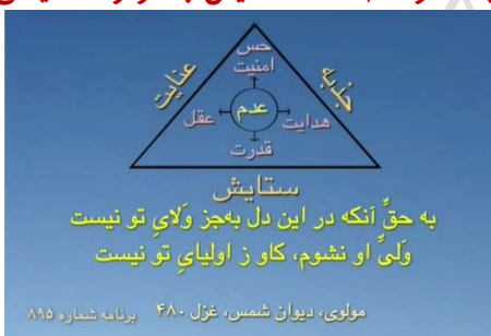
شکل شماره ۸ (مثلث ستایش با مرکز عدم)

و همین‌طور متوجه این شناسایی می‌شوید که تا به‌حال مرکزتان همانیده بوده [شکل شماره ۷ (مثلث ستایش با مرکز همانیدگی‌ها)]، دو تا خاصیت جذبۀ زندگی که ما را به‌صورت خودش به خودش دارد جذب می‌کند و عنایت زندگی، کمک و حمایت زندگی نسبت به انسان یا ما به‌اصطلاح صورت نمی‌گرفته برای این‌که هر لحظه مرکز ما همانیده بوده و ما ستایش بت می‌کردیم، یعنی همانیدگی‌ها را می‌کردیم و عقل و حس امنیت و هدایت و قدرت را از آنها می‌گرفتیم.