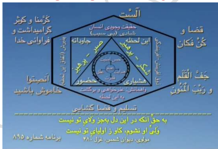
شکل شماره ۱۴ (شش محور اساسی زندگی با حقیقت وجودی انسان)