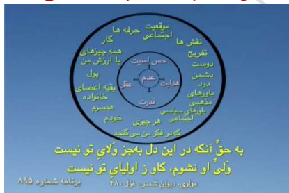
[شکل شماره ۲ (دایره عدم)]

می‌گوید که قبل از این‌که من به این جهان بیایم، از جنس تو بودم، الآن هم از جنس تو هستم، فقط یک اتفاق افتاده و آن اتفاق این است که من وارد این جهان شدم و شروع کردم به فکر کردن و در فکرم چیزهایی را تجسم کردم که پدر و مادرم و جامعه به من گفتند این‌ها مهم هستند و مهم به این تعریف که برای بقای تو لازم هستند که این‌ها را داشته باشی، برای زندگی تو این‌ها لازم هستند، مثل پدر و مادرت، مثل پولت، مثل حرفه‌ات، و هر چیزی که داخل این دایره [شکل شماره ۱ (دایره همانندگی‌ها)] نوشته شده و هر چیزی که به فکر می‌شود تجسم کرد و من با این‌ها همانیده شدم.